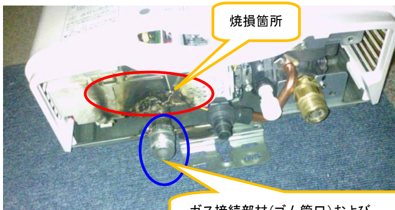
【現場写真】 (焼損箇所)