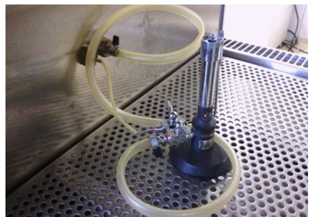
ガスバーナー (ブンゼンバーナー)