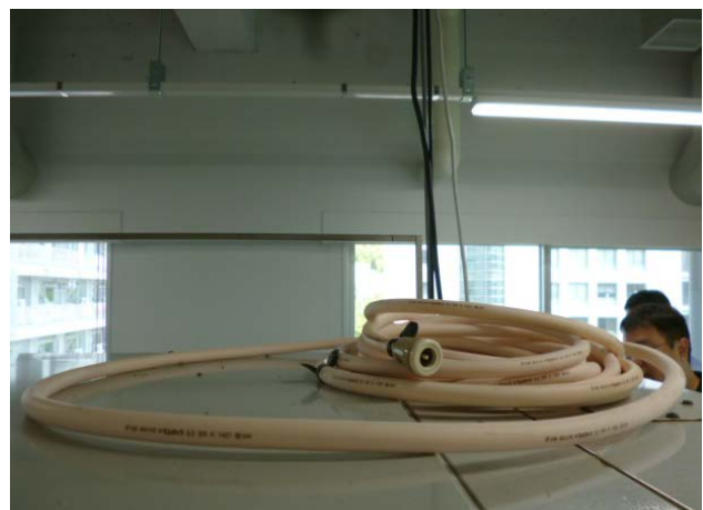
取り外したソフトコード