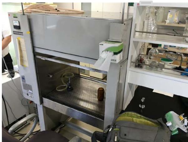
クリーンベンチ全景