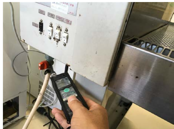
機器ガス栓 (ゴム管をつないだ状態)