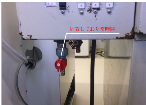
機器ガス栓 (ソフトコードを外した状態)