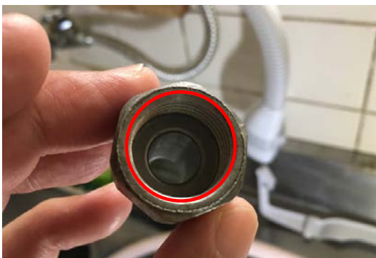
(ガス接続部材 (ゴム管口) の状況)