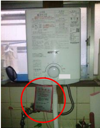
(応急措置状況 (使用禁止措置))