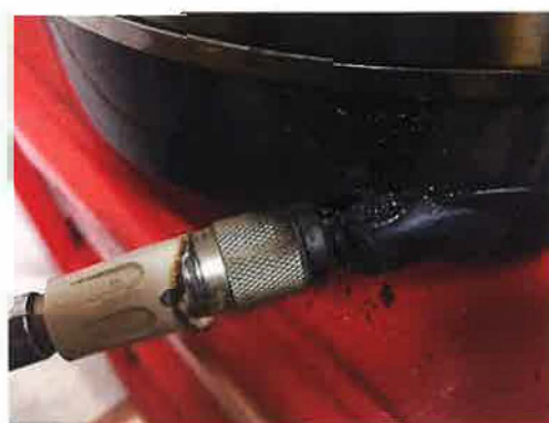
(接続部分の焼損状況)