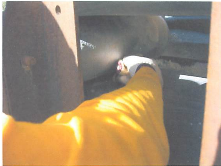
り災時の作業状況（再現）