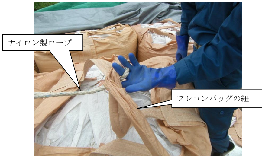
罹災状況(再現)拡大