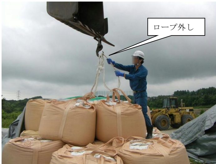
罹災時の作業状況(再現)