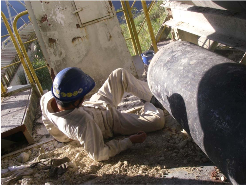
(1) 災害の状況 (再現: 下図とは逆方向から撮影) (罹災箇所はローラー(L=1.6m、φ500mm)の中央部付近)