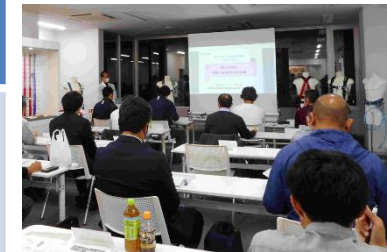
【写真1】 鉱山における墜落災害発生状況と対策