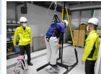
【写真3】 墜落制止用器具吊下がり体験等