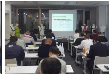
【写真2】 墜落制止用器具の規格、主な関連法規等