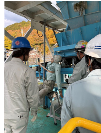
【写真1】 講義（災害発生のしくみと防止策）