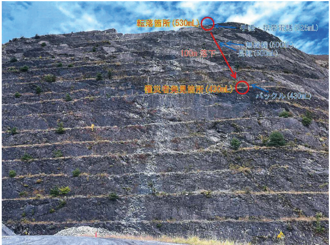
写真1. 罹災者転落推定箇所及び発見箇所 (352mLより撮影)