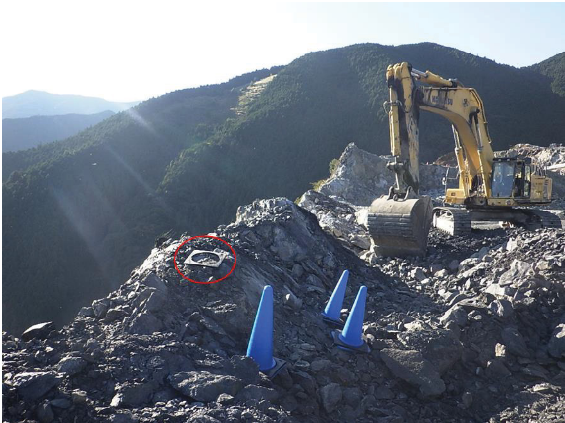
写真2. 罹災者転落推定箇所（530mL）とパワーショベルの位置関係