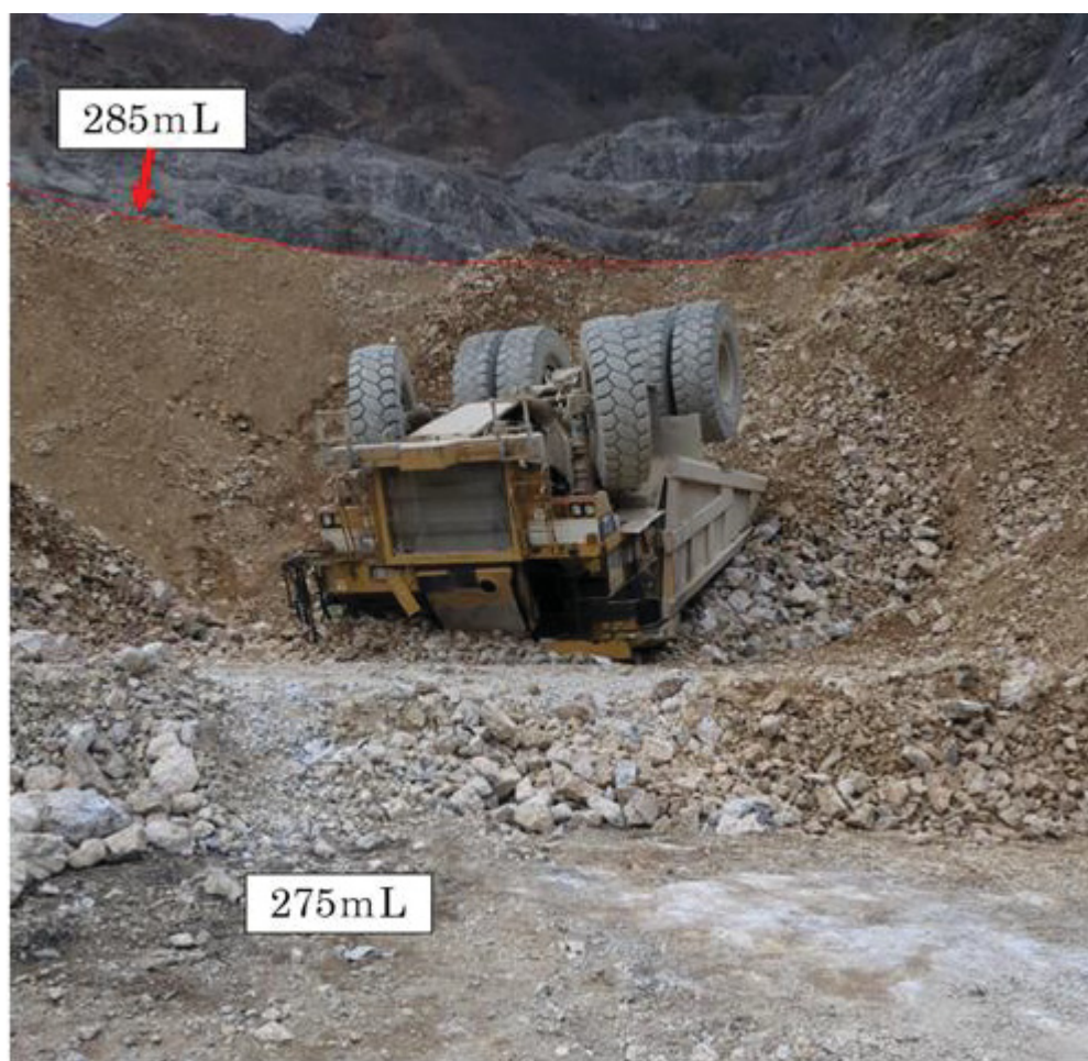
写真2. 罹災現場の状況 (275mLより撮影)