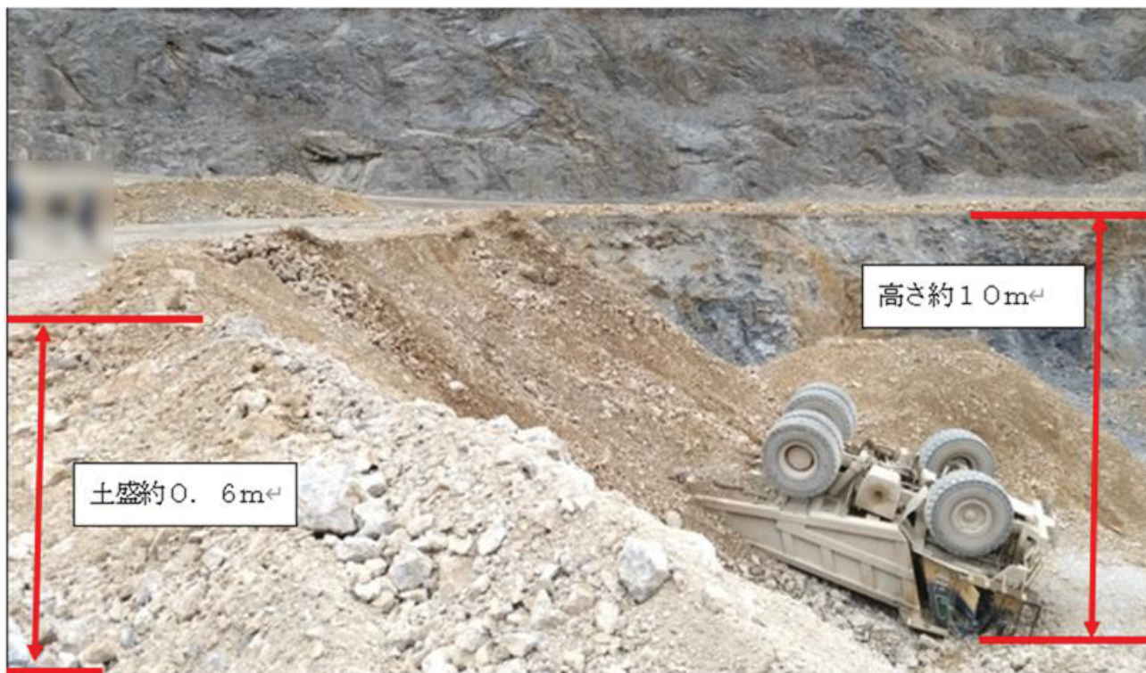
写真1. 罹災現場の状況 (285mLより撮影)