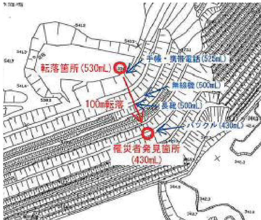
図1. 鉾山全景（上図）と転落推定箇所・発見箇所の拡大図（下図）