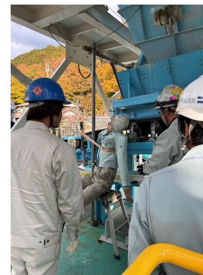
【写真1】 講義（災害発生のしくみと防止策）